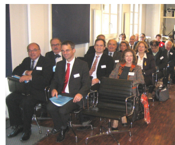
Strasbourg le 5 décembre - Fondue au Village Suisse