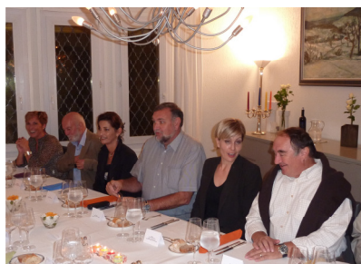
Marseille : Repas à la résidence