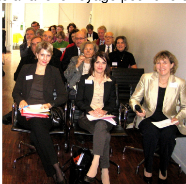
Paris – L'assemblée des présidents (2ème partie)